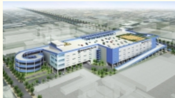
三郷ロジスティックセンター(仮称)完成予想図

従来のストック型ではなく、フロー型の大型物流施設として当社が運営するほか、フロアの一部については賃貸を行う方針で、本年5月に着工し平成20年4月の完成をめざしています。