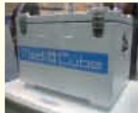
治験薬の定温輸送を可能にした「MediCube」 （縦45×横65×高さ48cm） ※特許出願中

国際共同治験の高まりによってグローバルな対応が求められるなか、来年にはこの治験薬総合物流サービスを国内だけでなく、海外でも展開させていく方針です。